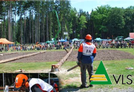
Disciplíny TĚŽBA a KOMBINOVANÝ ŘEZ v areálu VLS Skelná Hut' nedaleko Mimoně