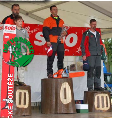
STUPNĚ VÍTĚZŮ - dřevorubci, níže operátoři