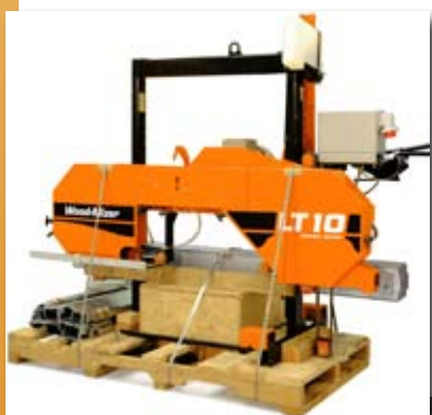
Pásová pila Wood-Mizer LT10

Sovadinova 6, 690 02 Břeclav tel/fax 519 322 443 info@wood-mizer.net www.wood-mizer.net