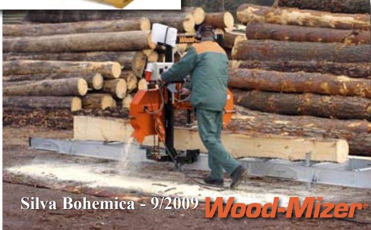
Pásová pila Wood-Mizer LT15