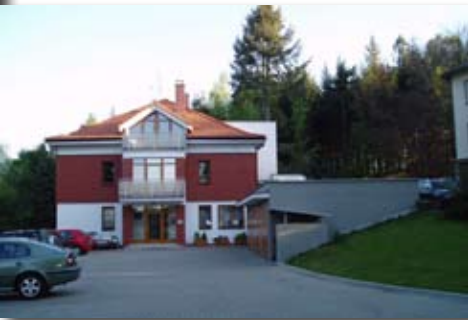
LČR - Lesní správa Pelhřimov

V ulici K SILU sídlí Městská správa lesů Pelhřimov, s.r.o. a současně i Sdružení vlastníků obecních a soukromých lesů