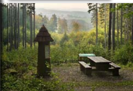
Naučná stezka STRNADOVA na revíru LČR Čeřínek