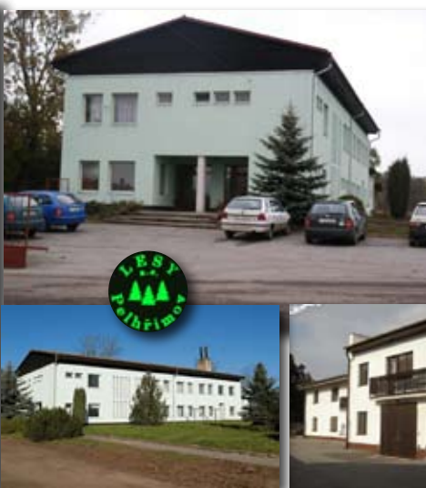
Frma LESY PELHŘIMOV, a.s.